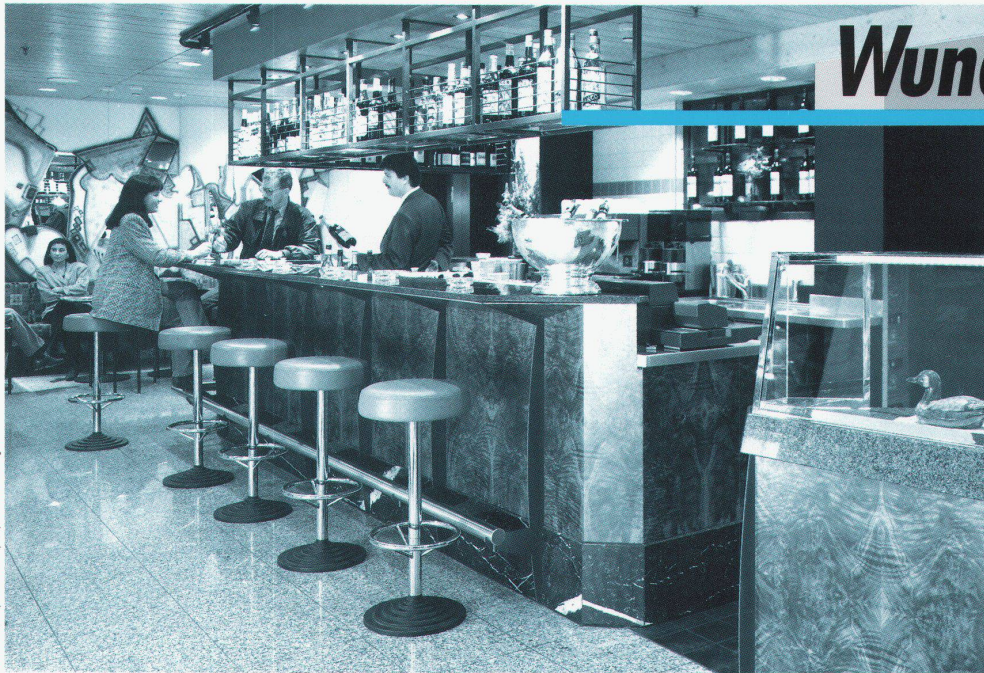
Bei Grand Cru, Mischelbach Zürich / Projekt: Inter-Concept-Design