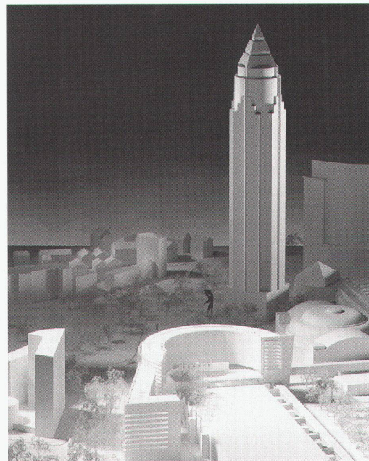
Das neue Kongresszentrum im Vordergrund bildet stadträumlich einen Abschluss für die Messehalle