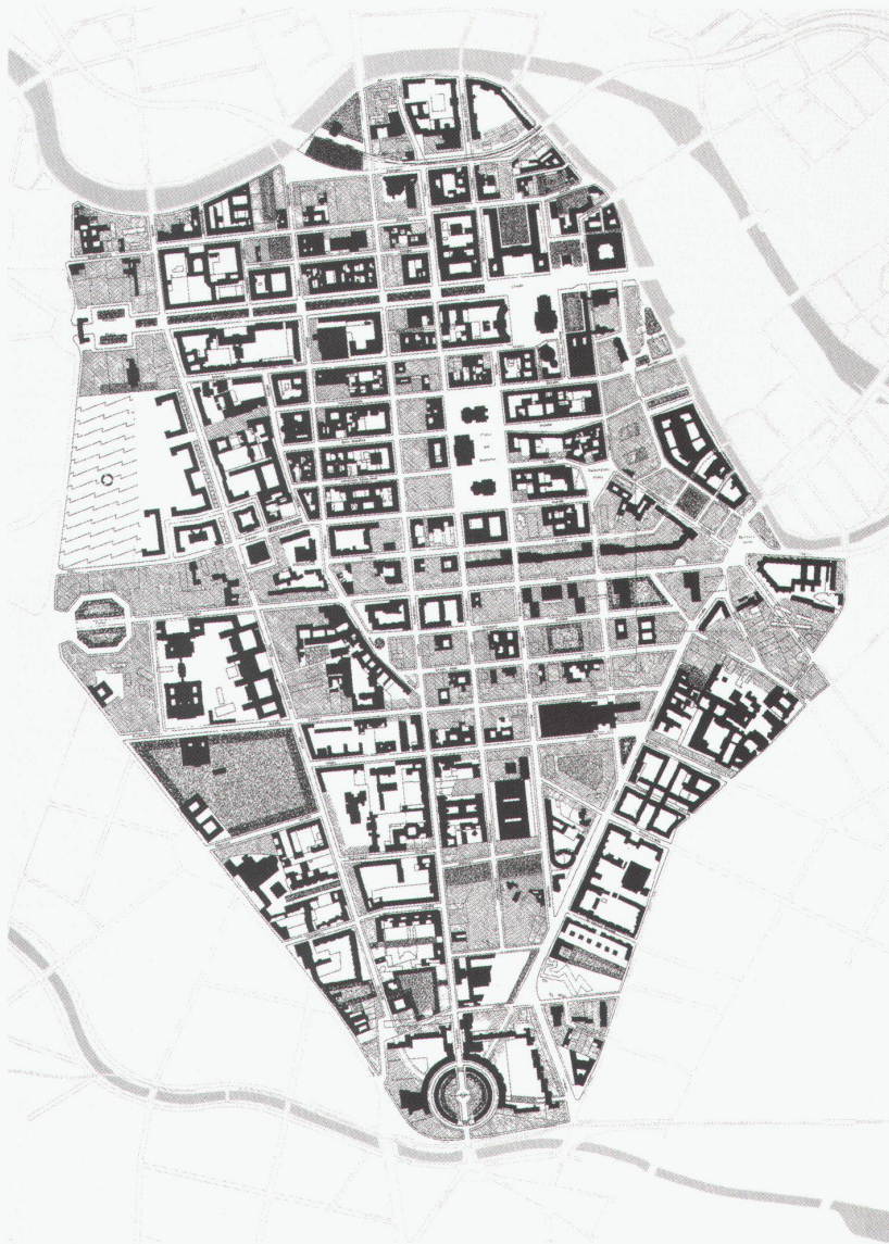
Übersichtsplan Dorotheen-/ Friedrichstadt, schwarz: vorhan- dener Baubestand; hellgrau: Reservoir der Bauflächen; dunkel- grau: Grünflächen

Für den Stadtentwicklungs-senator Volker Hassemer und für den Senator für Bau- und Wohnungswesen Wolfgang Nagel mag es ein ebenso spannendes Monopoly wie auch eine reale Herausforderung sein, den regen Kapitalfluss und seine Wirkung auf Berlins Mitte durchzuspielen. Eine Übersichtskarte aus dem Jahre 1991 zeigt, dass es die Kapitalanleger aus dem In- und Ausland in den ehemaligen Osten zieht: Von der Zimmerstrasse bis zum Bahnhof Friedrichstrasse reiht sich Block an Block zu einem riesigen Investitionsareal. Die Konkurrenz zweier Systeme ist damit beendet, die mit Hochhäusern an der Leipziger Strasse (Ost) und mit Prestigebauten an der Kochstrasse (West) den alten Stadtgrundriss zerstörte und dem Stadtzentrum seine Dichte nahm.