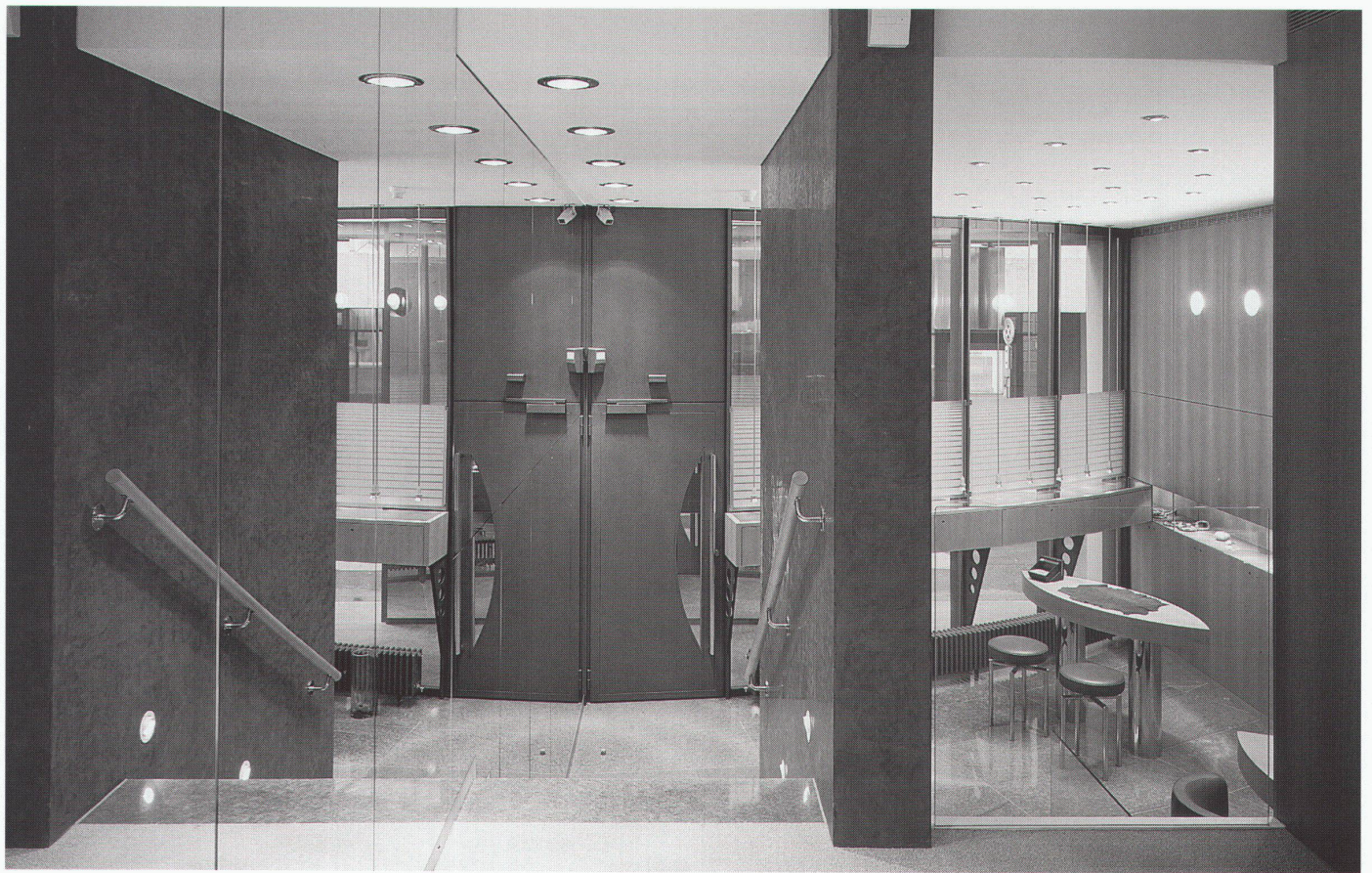
Blick vom Zwischengeschoss an die Innenfassade Vue depuis l'étage intermédiaire vers la façade intérieure