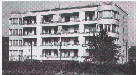
Holeestrasse 131-135, Basel; Architekt G. Panozzo

Bei diesem Beitrag wurden leider falsche Abbildungen publiziert. Wir zeigen nachstehend die genannten Bauten von Giovanni Panozzo.