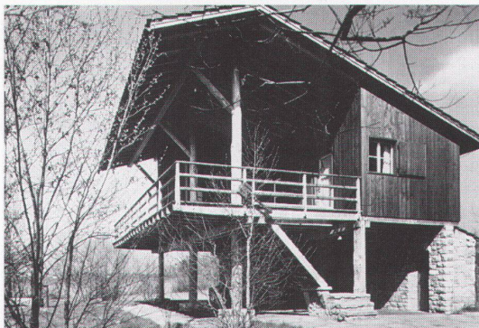
Ferienhaus Müller, Schenkon; Architekt G. Panozzo