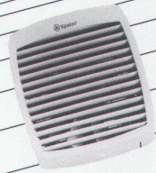
Fenster- und Wandventilatoren