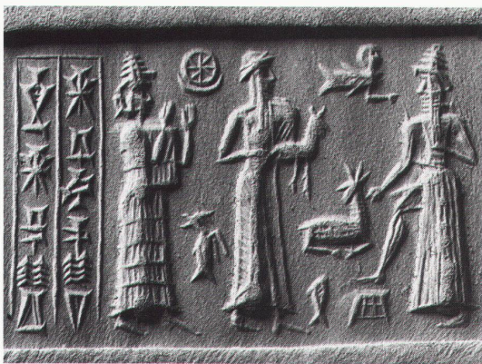
Karlsruhe, Badisches Landesmuseum: Rollsiegel aus der frühen Epoche an Euphrat und Tigris

Hannover, Sprengel-Museum Carl Fredrik Reuterswärd. Retrospektive bis 30.1.1994