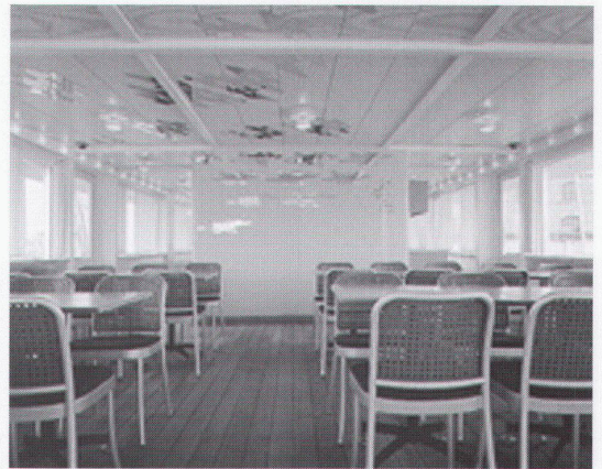
Einstiegdeck Pont d'accès