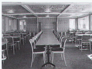
Die MS «St.Gallen» der SBB-Bodensee-Flotte MS «St.Gallen» de la flotte du lac de Constance