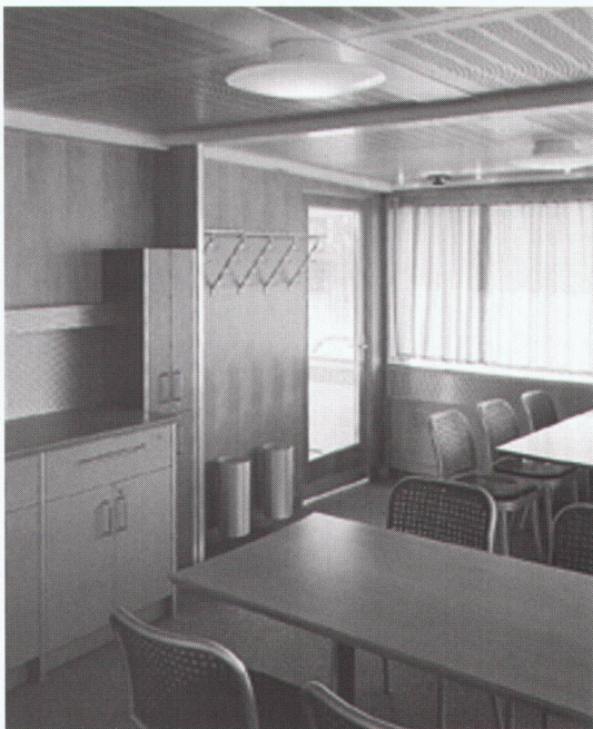
Einstiegdeck, hinten Pont d'accès, partie arrière