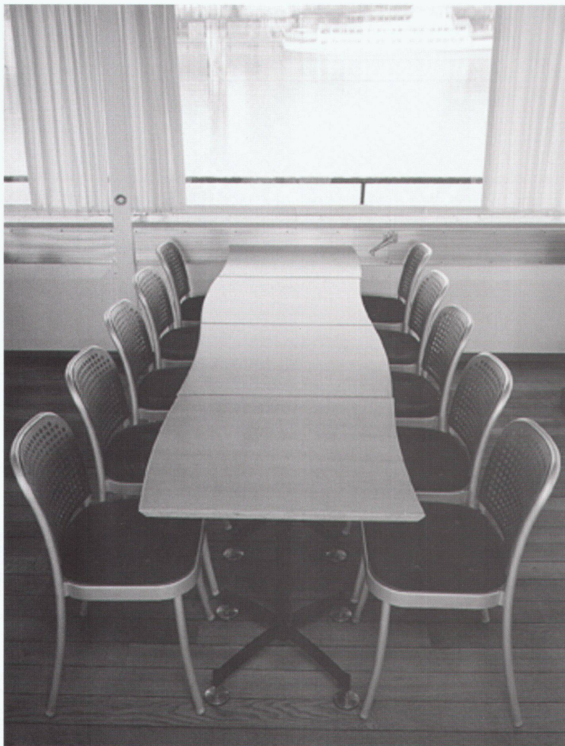
Oberdeck, hinten Pont supérieur, partie arrière