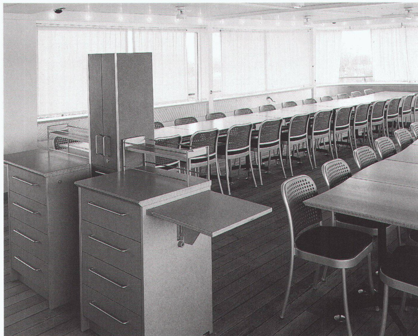
Oberdeck, vorne Pont supérieur, partie avant