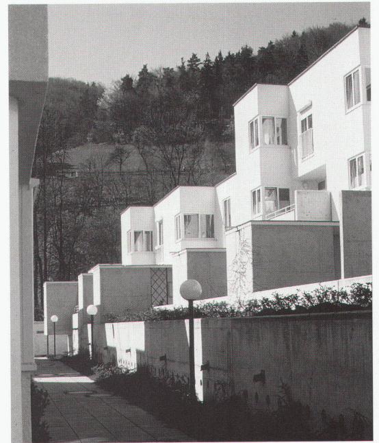
Wien, MAK – Museum für angewandte Kunst: Roland Rainer, Siedlung Leonfeldnerstrasse, Linz, Neue Heimat, 1986

Helsinki, Museum of Finnish Architecture Public Milieu. Survey of the building production of the National Board of Building bis 23.4.