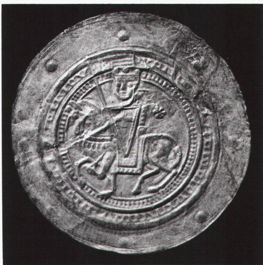
Chur, Rätisches Museum: Brakteat (1188?)

Chur, Rätisches Museum Der Kreuzzug Kaiser Barbarossas. Münzschütze seiner Zeit bis 21.5.