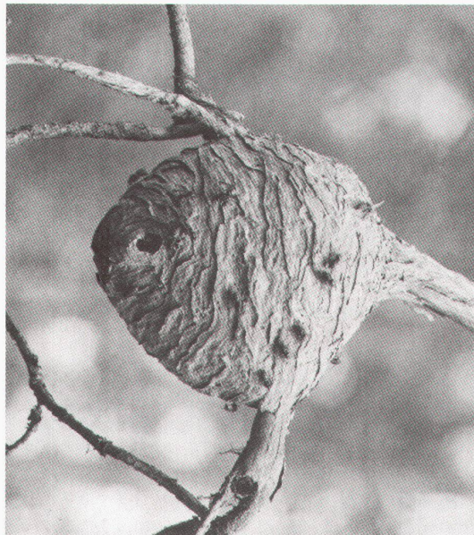
Helsinki, Finnisches Architekturmuseum: Wespennest (Architektur der Tiere)

Berlin, Berlinische Galerie, Martin-Gropius-Bau Unter grossen Dächern. Ar- chitekturbüro von Gerkan, Marg & Partner bis 25.6.