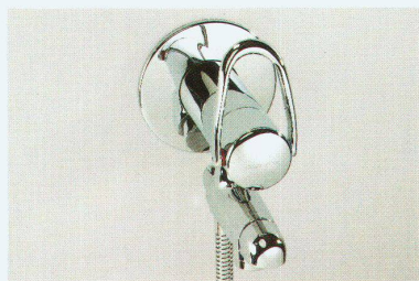
Bademischer arwa-class «1Point»