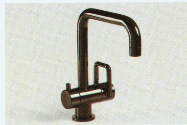
Waschtischmischer arwa-twin «1Point» (mit Eckadapter zum Rohbauset)