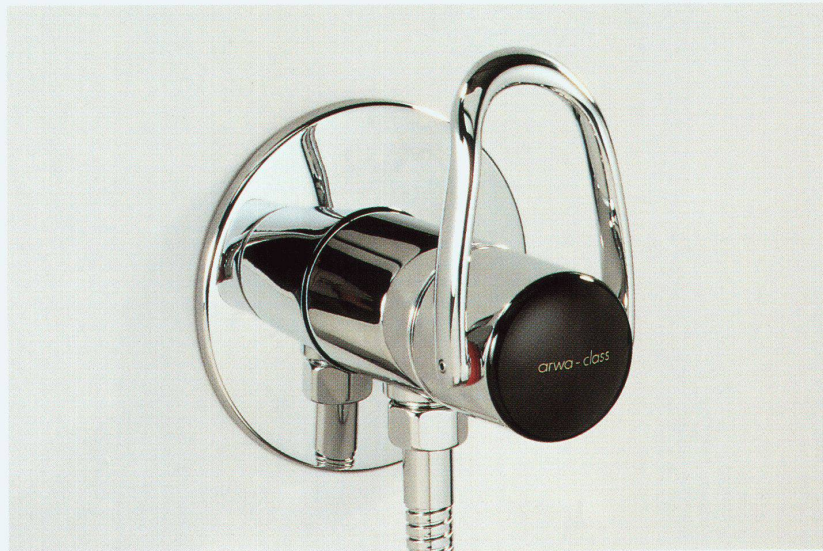
Duschenmischer arwa-class «1Point»