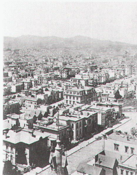
Zürich, ETH-Zentrum, Eadweard Muybridge: Panorama of San Francisco, 1878, zwei von 13 Tafeln

Berlin, Altes Museum am Lustgarten Architekturmodelle der Renaissance: Die Harmonie des Bauens von Alberti bis Michelangelo bis 7.1.1996