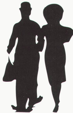
Zürich, Kunsthaus: 100 Jahre Film, Charles Chaplin, Modern Times

Köln, Museum Ludwig Jack Sal – Installation bis 26.11. Mario Giacomelli bis 31.12.