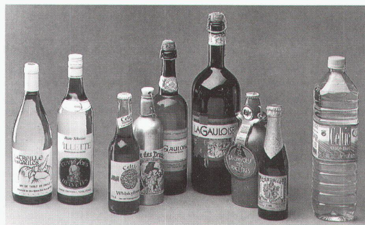
Lausanne-Vidy, Musée Romain: «Le passé recyclé»

Wien, Hermesvilla Jagdzeit: Österreichs Jagd- geschichte. Eine Pirsch bis 16.2.