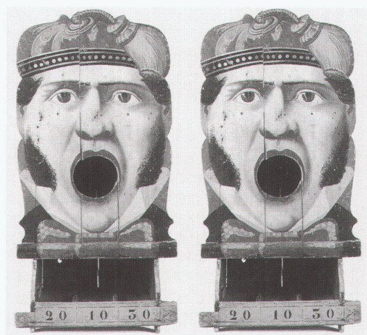
Strasbourg, Musée Alsacien: Qui perd gagne. Jeux de société

Hamm, Gustav-Lübecke-Museum Paul Klee: Reisen in den Süden 26.1.–13.4.