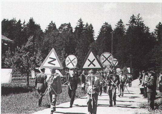
Zürich, Museum für Gestaltung: Die Strasse lebt, Fotografien 1938–1970