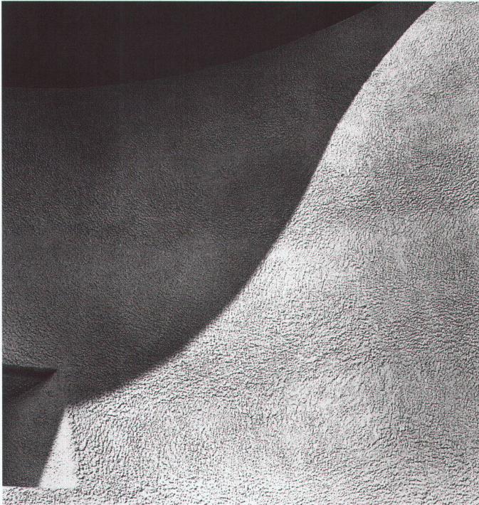
Wallfahrtskirche Notre-Dame-du-Haut, Ronchamp, 1956

Das Vitra Design Museum in Weil am Rhein zeigt noch bis zum 26. Oktober Architekturfotografien von Lucien Hervé, der über Jahrzehnte persönlicher Fotograf von Le Corbusier war.