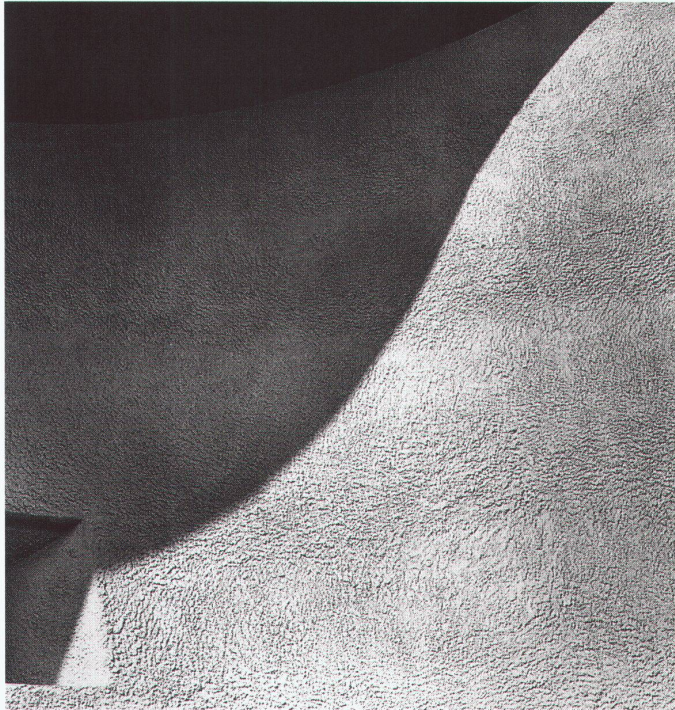
Wallfahrtskirche Notre-Dame-du-Haut, Ronchamp, 1956

Das Vitra Design Museum in Weil am Rhein zeigt noch bis zum 26. Oktober Architekturfotografien von Lucien Hervé, der über Jahrzehnte persönlicher Fotograf von Le Corbusier war.