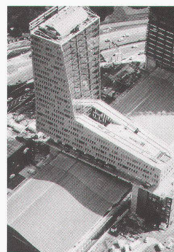
Wien, Architekturzentrum: Euralille: Creating a New City, Christian de Portzamparc. La tour du Crédit Lyonnais

Bordeaux, arc en rêve centre d'architecture 36 modèles de maisons bis 18.1.1998