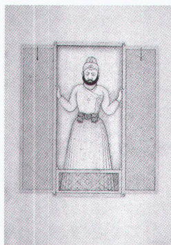
Zürich, Haus zum Kiel: Nainsukh of Guler

Museum im Lagerhaus Das Wunderbare des Pierre Bonnard bis 1.2.