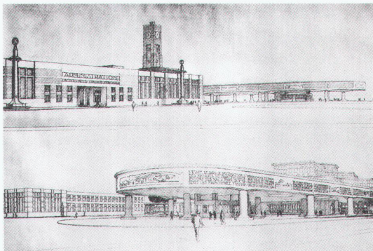
Zürich, ETH-Hönggerberg: Tony Garnier, Une cité industrielle, Versammlungssäle, Verwaltung mit Vorhalle; Perspektiven, undatiert

In der zweiten Wettbe- werbsstufe ist ein Projekt im Massstab 1:200 zu erarbei- ten. Die Beurteilung beider Wettbewerbsstufen erfolgt durch das gleiche Preis- gericht. Die Teilnehmer blei- ben während des ganzen Verfahrens anonym. Die