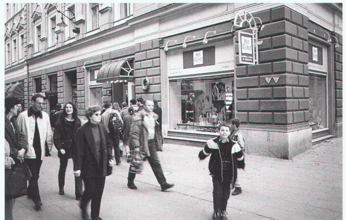
Parfümerie Yves Rocher in der vormaligen Bäckerei an der Ferhadija-Strasse, wo eine der ersten Bomben mehrere Leute tötete, die vor dem Geschäft Schlange standen.