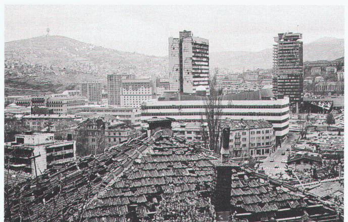
Blick auf Nova Sarajevo, von der alten Stadt aus gesehen. In Bildmitte links vom Hochhaus das jetzt so berühmte Holiday Inn.