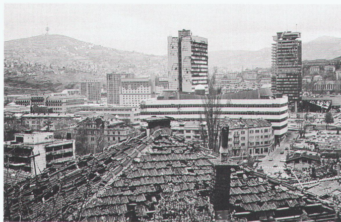
Blick auf Nova Sarajevo, von der alten Stadt aus gesehen. In Bildmitte links vom Hochhaus das jetzt so berühmte Holiday Inn.