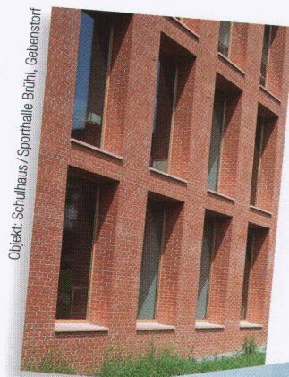
Objekt: Schulhaus / Sporthalle Brühl, Gebenstorf