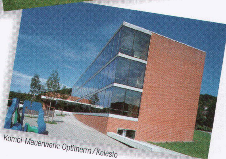
Kombi-Mauerwerk: Optitherm / Kelesto