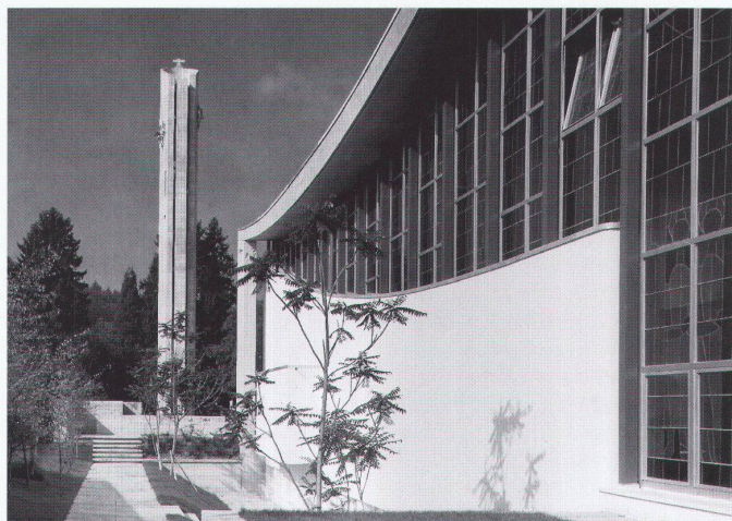
Kirche Heilig Geist, Suhr/AG, 1959/61