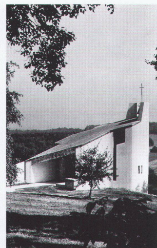
Muttergotteskapelle, Niesenberg/AG, 1961/62