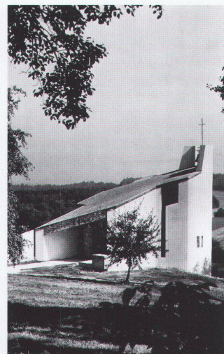
Muttergotteskapelle, Niesenberg/AG, 1961/62