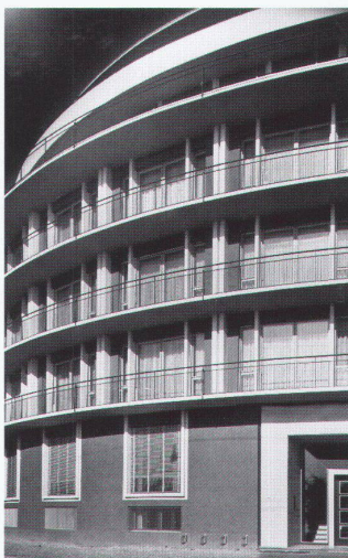
Geschäfts- und Wohnhaus Seepark in Zug, 1953/55