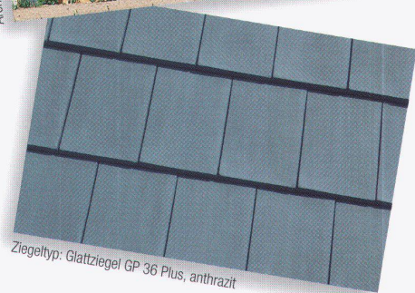
Ziegeltyp: Glattziegel GP 36 Plus, anthrazit

Das Prädikat wertvoll für Objekt und Material. Der elegante Glattziegel GP 36 Plus der Keller AG Ziegeleien für einheimische Qualität in der Architektur.