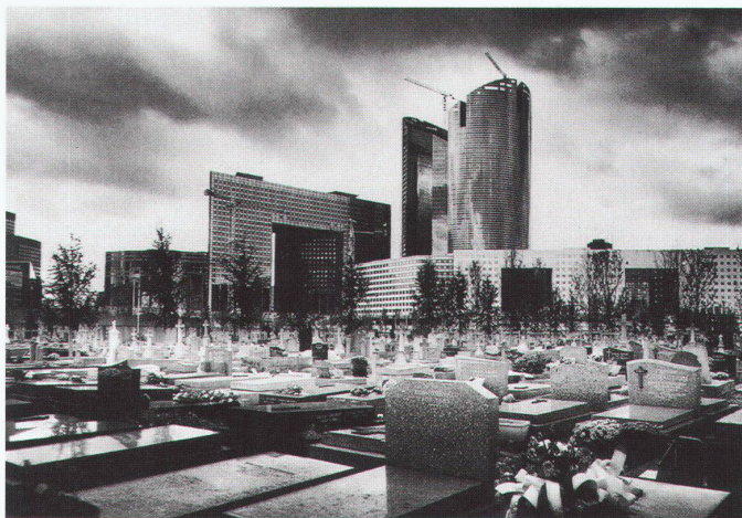
Paris Nanterre 1995

Zum drittenmal vergibt die «deutsche bauzeitung» einen Preis für Europäische Architekturphotografie. Nach den Themen «Mensch und Architektur» vor drei Jahren und «Architektur schwarzweiss» 1997 steht ein weiterer wichtiger Aspekt der Architekturphotografie im Mittelpunkt: die Frage nach dem Ort, der Umgebung eines Gebäudes. Gezeigt werden soll, ob und wie die Umgebung ein Gebäude geprägt hat. Wurde auf