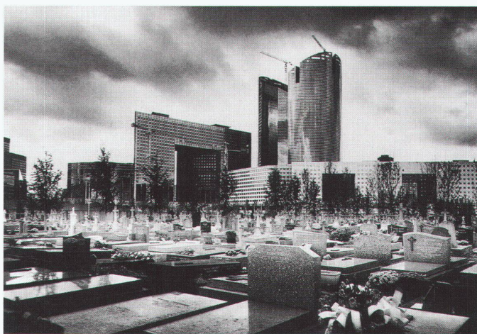
Paris Nanterre 1995

Zum drittenmal vergibt die «deutsche bauzeitung» einen Preis für Europäische Architektur fotografie. Nach den Themen «Mensch und Architektur» vor drei Jahren und «Architektur schwarzweiss» 1997 steht ein weiterer wichtiger Aspekt der Architektur fotografie im Mittelpunkt: die Frage nach dem Ort, der Umgebung eines Gebäudes. Gezeigt werden soll, ob und wie die Umgebung ein Gebäude geprägt hat. Wurde auf