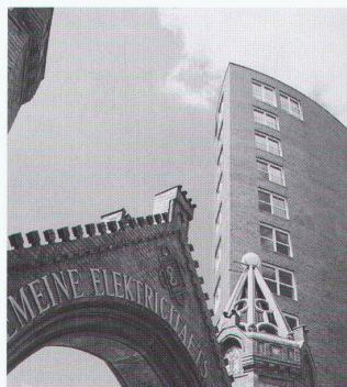
Josef Paul Kleihues: Büroturnm, Brunnenstrasse, Berlin

Darüber, welche Rolle er im heutigen Baugeschehen der Hauptstadt spielt, ist in den letzten Jahren viel debattiert worden. Doch die dichotome Gegenüberstellung von Materialien wie Glas (= modern) und Stein (= traditionell), wie sie die Diskussion um die Berliner Architektur in ihrer ganzen intellektuellen Verkürzung bestimmte, stellt einen Anachronismus dar, mit dem Kleihues nichts zu schaffen hat, obgleich er doch beständig als Protagonist des «Architekten-Kartells»