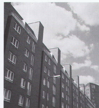
Josef Paul Kleihues: Wohnüberbauung Brunnenstrasse, Berlin

genannt wurde. Trotz eines weltweiten Aktionsradius – was seine Bauten, aber auch seine Bewunderer angeht – darf Berlin nach wie vor als Mittelpunkt seines Wirkens gelten: Das zeigen nicht nur «Kontorhaus Mitte» und «Triangel-Haus» an der Friedrichstrasse, sondern auch der Umbau des Hamburger Bahnhofs. Den Boden für solche Projekte hat er selbst bereitet: Zwar nicht allein, aber doch in verantwortlicher Position organisierte er seit 1979 die Internationale Bauausstellung (IBA) und verhalf ihr zu einer Aufsehen erregenden Umsetzung. Und das seinerzeitige Programm ist, wie das «Planwerk Innenstadt» signalisiert, immer noch en vogue. Denn damals wie heute sollte die Aufnahme und Neuinterpretation überlieferter Stadtstrukturen vornehmlich zur Rückgewinnung der Stadt als Wohn- und Lebensraum dienen. Ein hehrer Anspruch!