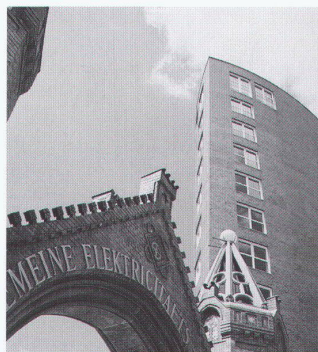
Josef Paul Kleihues: Büroturnm, Brunnenstrasse, Berlin

Darüber, welche Rolle er im heutigen Baugeschehen der Hauptstadt spielt, ist in den letzten Jahren viel debattiert worden. Doch die dichotome Gegenüberstellung von Materialien wie Glas (= modern) und Stein (= traditionell), wie sie die Diskussion um die Berliner Architektur in ihrer ganzen intellektuellen Verkürzung bestimmte, stellt einen Anachronismus dar, mit dem Kleihues nichts zu schaffen hat, obgleich er doch beständig als Protagonist des «Architekten-Kartells»