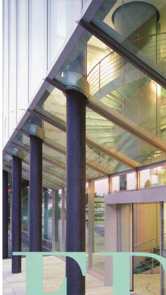
Die dreigeschossige Eingangshalle, transparentes Herzstück des neuen Verwaltungsgebäude der EWBO/OES AG, Illanz. Architekt: Jakob Moutilla.