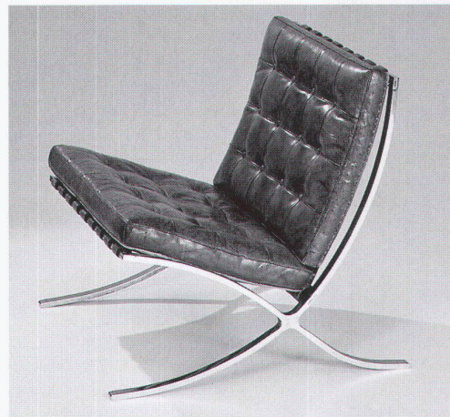
Der Barcelona-Sessel von Mies van der Rohe