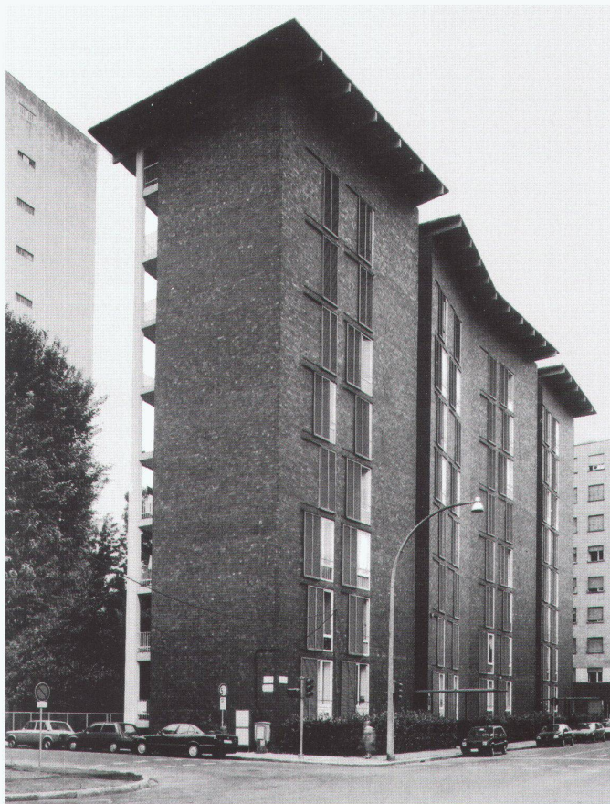
Case per impiegati della Borsalino, Alessandria, 1950–1952

Die Casa Tonella (1947/48) und das Wohnhaus in der Via Marcogiondi (1949–1954), beide in Mailand, verschmelzen die modernen Anliegen des Planes von «Milano Verde» von hellen, lichtdurchfluteten Wohnungen in durchgrünem Aussenraum mit den «Bedürfnissen» ihrer Bewohner nach Tradition. Die Längsseiten sind zur Sonne hin entweder strukturell durch Terrassen geöffnet oder von horizontalen Fensterbändern mit Terrassenrücksprüngen unterbrochen. Hinten und seitlich sind sie durch Lochfassaden traditionell geschlossen. Selbst ein vorhandener Baum ist durch Ausparungen in die Terrasse integriert worden. Wie Albini neigte auch Gar-