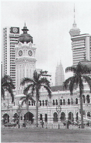
Blick über das Sultan Abdul Samad Building Richtung Osten (im Hintergrund: Petronas Twin Towers)

So gravierend und stetig sich die städtische Textur verändert, so gross ist der Druck auf die Stadtverwaltung: Widmungen werden schnell geändert, Baugenehmigungen grosszügig erteilt, wenn das Projekt dem Image von KL zuträglich erscheint. Mit der Implementierung einer veritablen und verbindlichen Flächennutzungs- oder Masterplanung indes hat sich Kuala Lumpur immer schwer getan: Stadtplanung ist hier kein aktives Steuerungsinstrument. Um Infrastruktur und Bauvorschriften kümmerte sich hauptsächlich der 1890 eingerichtete Kuala Lumpur Sanitary Board. Und wenn es denn einen Plan gibt, wie den so genannten Structure Plan und den Local Plan, so wird seine Ausführung scheinbar dem Zufall – und den Spekulanten – überlassen. So nimmt es nicht wunder, wenn es keine planerischen Parameter zu geben scheint, ausser einer weitgehend kritiklosen Akzeptanz des Marktes und vielleicht einer gewissen Rücksicht auf das Klima. Deshalb – und da die asiatische Mentalität nicht nur Obrigkeits-, sondern auch Schicksalsglauben kennt – sind alle städtebaulichen Pläne, die das Wachstum steuern sollen, trotz autoritärer politischer Strukturen gescheitert. Und trotzdem – oder gerade deswegen – ist KL mittlerweile zu einem der wichtigsten Drehpunkte Asiens geworden.