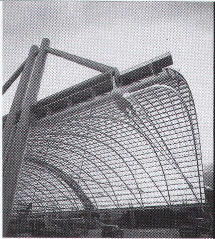
Projekt: Postausstation Chur Halendäch - Architekten: Brossi Chur & Obrist St. Moritz

Stahl-Glas-Konstruktionen in architektonisch perfekter Vollendung verwirklichen wir mit innovativen Ideen und höchsten Anforderungen an Materialien und Ausführung.