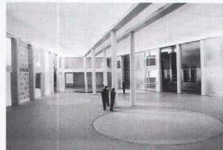
Edith Nafzger: Modell des öffentlichen Lichthofes