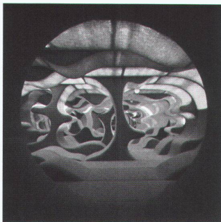
«Phantasy landscape» Visiona II Möbelmesse Köln, 1970

Nachdem im Zuge von Ölkrise und Ökologiethematik Pantons bunte Polyesterwelt in Verruf und Vergessenheit geraten ist, erlebt sie derzeit ein eigentliches Revival, was nicht zuletzt durch die Verwandtschaft seiner visionären Raumkonzepte mit virtuellen Computerwelten erklärt werden kann. Nach den Ausstellungen von 1998 in Dänemark und 1999 im Londoner Design-Museum ist dies bereits die dritte Würdigung innerhalb dreier Jahre.