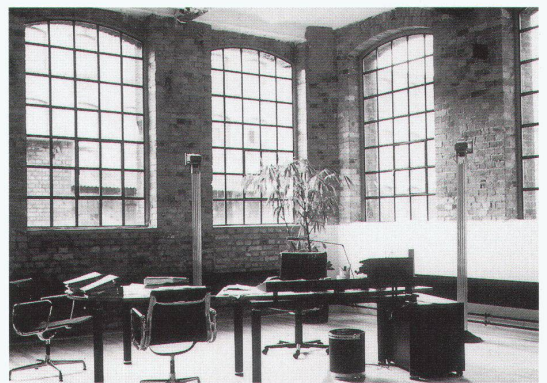
Hannover, Laves-Haus: Neue Büro- und Gewerberäume in der ehemaligen Schraubenfabrik Heyne, Offenbach

«Umnutzung im Bestand – neue Zwecke für alte Gebäude» bis 25.5. Tel. 0049 511 280 96 0