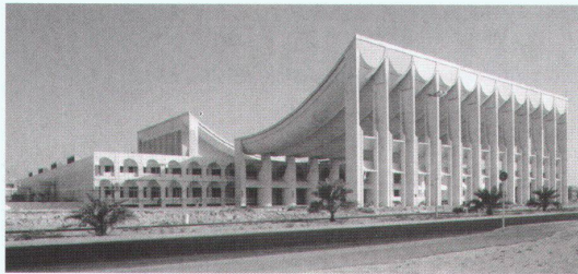
ETH-Hönggerberg, Zürich: Jørn Utzon: Parlamentsgebäude in Kuwait, 1972–1984.

Eau et Paysage Henri Bava, Michel Hoessler, Olivier Philippe: l'Agence TER bis 30.4. Tel. 0033 1 49 96 64 00 http://perso.club-internet.fr/tha