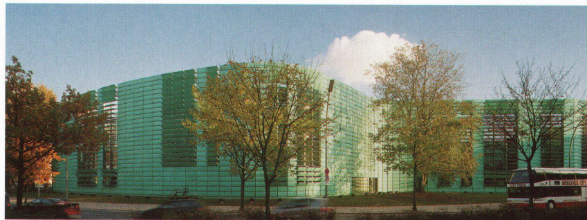
Objekt Nordische Botschaften, Berlin Architekten Berger + Parkkinen, Wien

TECU®-Patina – natürlich patinierte Kupferprodukte mit allen positiven Eigenschaften von klassischem Kupfer. Für Dächer, Fassaden und Innenbereiche.