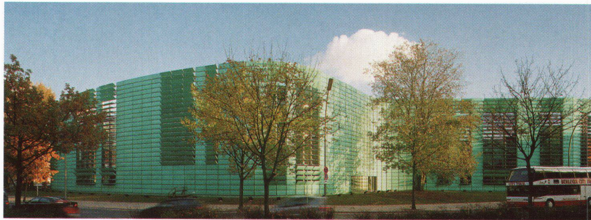
Objekt Nordische Botschaften, Berlin Architekten Berger + Parkkinen, Wien

TECU ® -Patina – natürlich patinierte Kupferprodukte mit allen positiven Eigenschaften von klassischem Kupfer. Für Dächer, Fassaden und Innenbereiche.