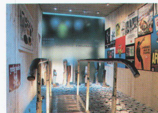
Blick von der Ruhe- und Informationszone auf die neuen Ausstellungseinheiten

zi nel 1864 fino ad ora. Il pubblico passa in uno spazio sotterraneo, volutamente mantenuto nell'oscurità le differenti sezioni legati al movimento. Nella sezione storica gli oggetti esposti e l'allestimento per lo più si corrispondono. La luce è usata in modo da ottenere un'intensificazione teatrale del percorso espositivo. Nella nuova sezione cinque semplici cubi in legno scuro costituiscono dell'esposizione l'architettura vera e propria. I cubi espositivi sono illuminati dall'interno, attraverso una lastra in vetro semitrasparente si osservano i contorni schematici degli oggetti esposti. Per misurarsi a fondo con la tematica dell'allestimento si deve però entrare nei cubi. Al loro interno nessuna messa in scena teatrale bensì molte testimonianze originali, classificate in modo sobrio. L'elaborazione estetica e l'architettura creano la distanza necessaria per non trasformare il pubblico in uno spettatore voyeuristico delle sofferenze altrui.