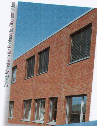
Objekt: Wohnheim für Behinderte, Oberentfelden