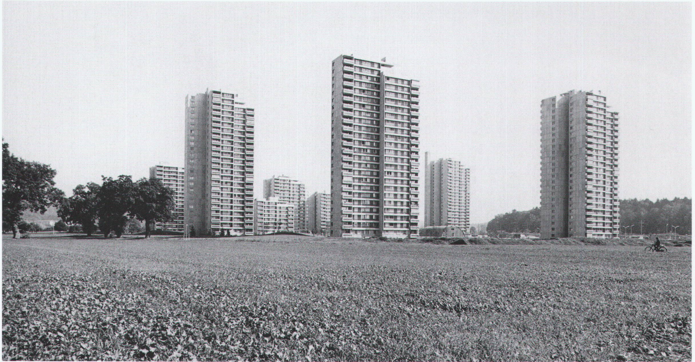
Blick von Nordwesten (um 1976)