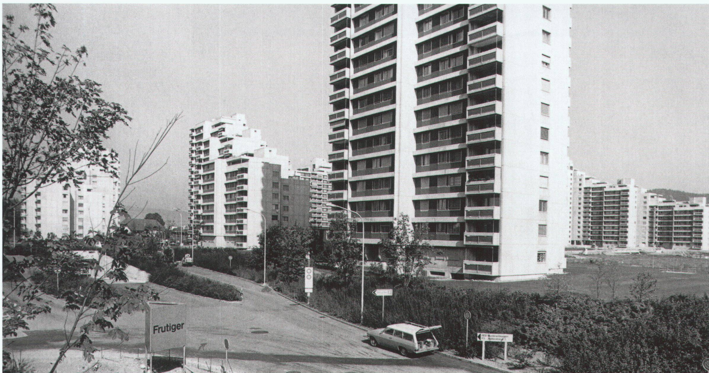
Westliche Zufahrt mit Rampe zur unterirdischen Verkehrsebene (um 1976)

nales Einkaufszentrum vorgesehen. Die Planung sollte somit, als städtebauliche Grosseinheit am Stadtrand, die Sogwirkung des Stadtzentrums brechen und regional für eine ausgeglichene Entwicklung sorgen. Die über 5500 Wohnungen verteilten sich auf sieben bebauungsmässige unterschiedliche Quartiere. Die beiden hauptsächlichen Bebauungstypen bildeten einerseits Punkthochhäuser mit über zwanzig Stockwerken und andererseits stufenförmig gestaffelte Kettenhäuser mit zwischen fünf und fünfzehn Etagen, die zu Nachbarschaften gruppiert wurden. In einigen Quartieren wurden diese Typen mit Einfamilienhäusern ergänzt. Zudem war ein Quartier als reines Villenquartier geplant.