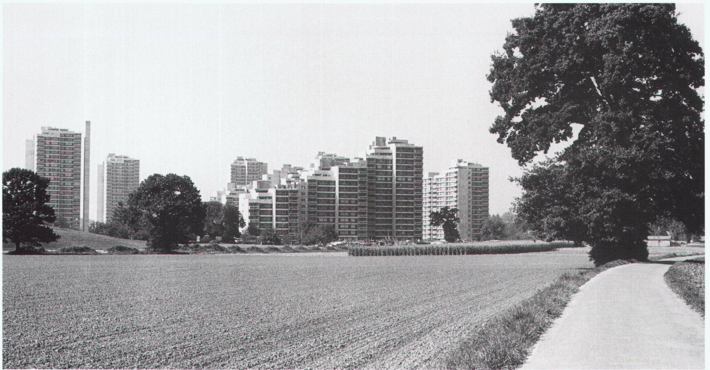
Blick vom Melchenbühlweg auf die Überbauung (um 1976)

bodenpolitisch unter ausnehmend günstigen Vorzeichen. Normalerweise scheiterten nämlich städtebauliche Grossvorhaben bereits an der starken Zersplitterung des Bodeneigentums. Im Oberen Murifeld hingegen konzentrierte sich der Bodenbesitz weitgehend auf die Burggemeinde und die Erbgemeinschaft Wittigkofen. Damit herrschten gewissermassen städtebauliche Laborbedingungen, die – zusätzlich gestützt durch überaus kooperationsbereite Behörden – die Ausarbeitung «zeitgemässer» städtebaulicher Lösungen ermöglichten.