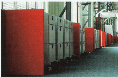
Schwebende Konferenzboxen über dem Desk-Sharing-Bereich

Les collaborateurs ou «nomades modernes» de Andersen Consulting par contre ont trouvé, au second étage de la poste du Zürcher Fraumünster, une élégante ambiance hôtelière. La situation en vue dans la City de cet édifice historique a justifié les modifications spatiales intérieures en vue de remettre en concordance avec le contexte les installations technico-fonctionnelles ajoutées par Swisscom. Le confort et l'agrément du séjour devaient en outre assurer l'identification au milieu de travail. Pour cette transformation, Grego/Smolenicky se sont concentrés sur la partie réception suivie par la zone de Desk Sharing. On y a supprimé la galerie et une «peinture architecturale» au jeu de couleurs subtil et un aménagement intérieur amène ont permis de créer un espace monumental et tranquille.