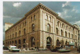
Andersen Consulting, Office Zürich, 1999

Komfort und Wohnlichkeit standen bei der Arbeitsplatzgestaltung im Vordergrund. Das Arbeitsumfeld soll so angenehm wie möglich sein und eine Identifikation mit dem temporären Arbeitsort erleichtern. Grego und Smolenicky wollten dabei sogar auf die typische Bürobestuhlung verzichten. Das gewählte Bürosystem wurde angepasst, um eine grösstmögliche Homogenität und Ruhe zu erzeugen. Unterstützt wird diese Ambience durch ein dezentes Farbkonzept und akustische Paneele. Die Sitzungsräume, Einzelbüros und die flussseitige Cafeteria gehen links vom Empfang aus unscheinbar ab. Bei Letzteren musste ein Kompromiss zwischen bestehenden Einbauten und Einrichtungskonzept geschlossen werden. Der unvermeidliche Bruch wird aber durch den bleibenden Eindruck der Eingangshalle weitgehend aufgehoben. Einzig in den Sitzungszimmern wird das Grandhotel-Thema über die Wandgestaltung noch einmal konsequent durchgezogen. Bilderartige rote Stoffpaneele, hinter denen nahtlos die Faltschiebewände versteckt werden, ordnen und zentrieren auch hier den Raum. Der unglaublichen Dynamik des Unternehmens wird an der Fraumünstergasse also ganz dezidiert ein durch den Kontext motiviertes, fast schon konservatives Ambiente entgegengesetzt, während in Oerlikon die Visualisierung dieser Dynamik das Büro zu einem Global Village en miniature werden lässt. Christina Horisberger