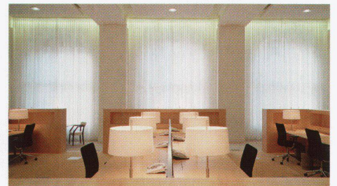
Empfang mit dahinter liegendem Desk-Sharing-Bereich