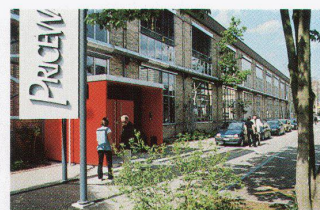
Provisorium PriceWaterhouse Coopers, Management Consulting Services (MCS), ABB-Halle 550, Oerlikon 1999