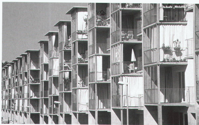
Wohnüberbauung Luzernerring, Basel, Ausschnitt der Südwestfassade

Wenn im Todesjahr von Michael Alder die Architekturbienale auf die Ethik rekurriert, kann man sich schon fragen, was das für ein Architekturbegriff sei, der dies wieder zum Programm machen muss. Der Verdacht kommt auf, dass sich die Vertreter der ästhetisch dominierten Architekturkonzepte immer erst der Ethik erinnern, wenn die formalen Ressourcen knapp werden und man sich aus einem erweiterten Beobachtungsfeld neue Impulse erhofft. Michael Alder dachte permanent an