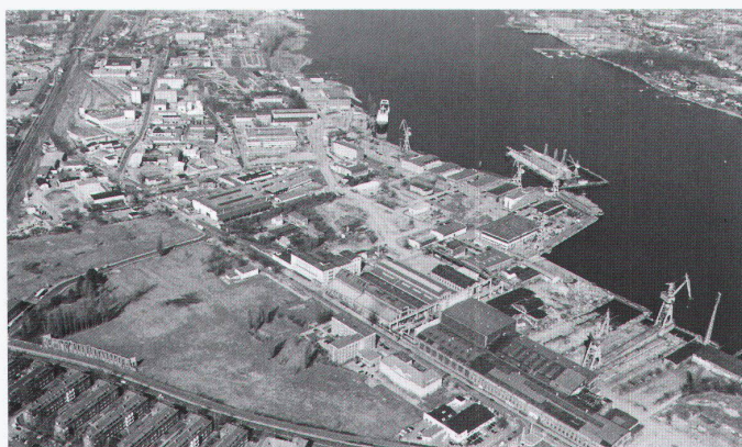
Ehemalige Neptunwerft, Aufnahme März 1999 (ungefähr heutiger Zustand), äussere Umrandung: Gesamtareal, innere Umrandung: veräussertes Gebiet.