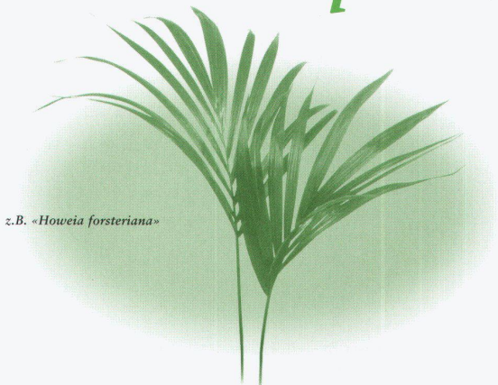
z.B. «Howeia forsteriana»