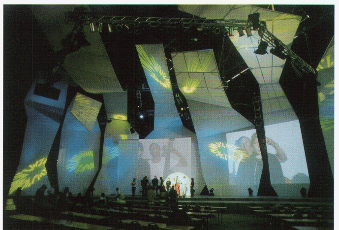
«Spurendenken», SHE_arch, Hamburg