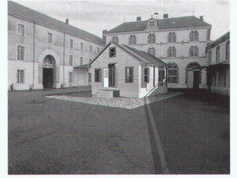
2 | Kyong Park, Detroit: «24620», Installation in Orléans