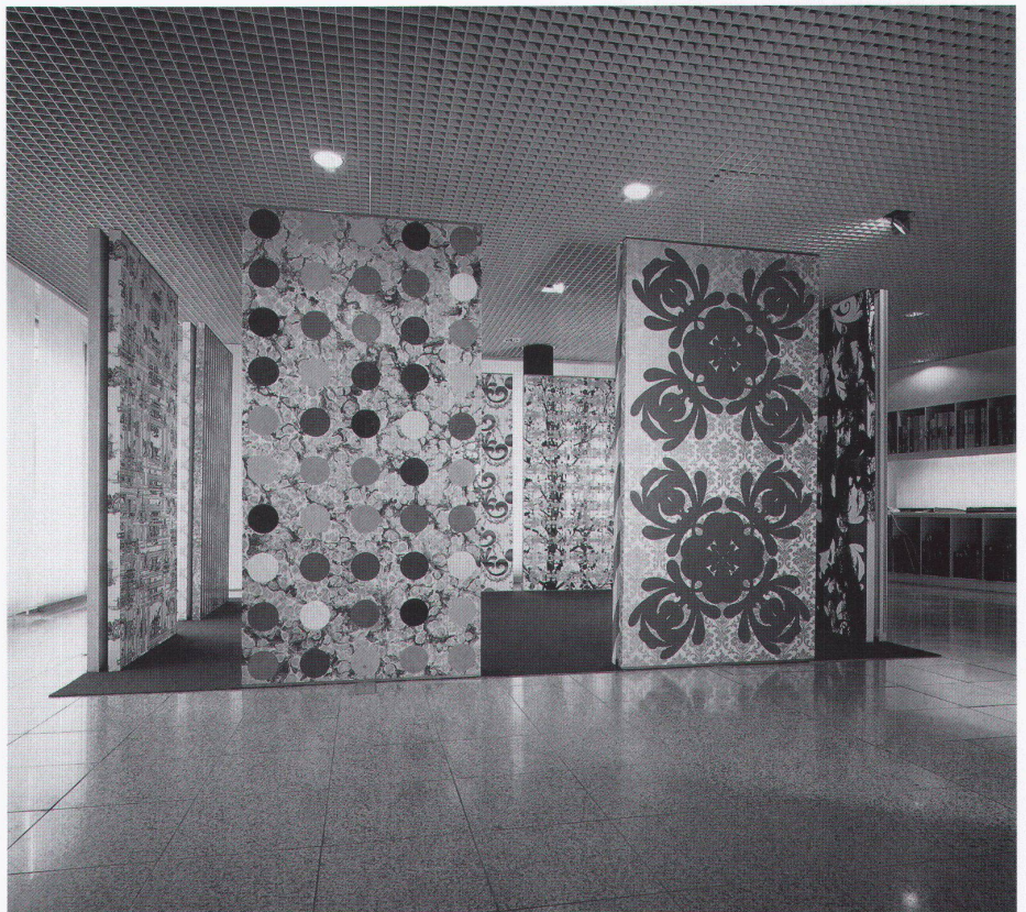
Installation Patternbeauty for Rooms bei Tapeten Spörri

Die Tapete hat seit ihrer Hochblüte im 18. Jahrhundert verschiedene Phasen der Anerkennung und Missbilligung erlebt. Nach Jahrzehnten der Verbannung ist heute besonders bei jüngeren Innenarchitektinnen und Innenarchitekten ein neuer und unverkrampfter Umgang mit dem umstrittenen Gestaltungsmittel festzustellen. In diesem Zusammenhang fällt eine experimentelle Arbeit von Karin Wälchli und Guido Reichlin auf, die einen künstlerischen Beitrag zur zeitgenössischen, ornamentalen Raumgestaltung darstellt.