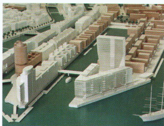
Wettbewerb MediaCityPort Hamburg, 1. Preis, Büro Benthem, Crowel, Amsterdam