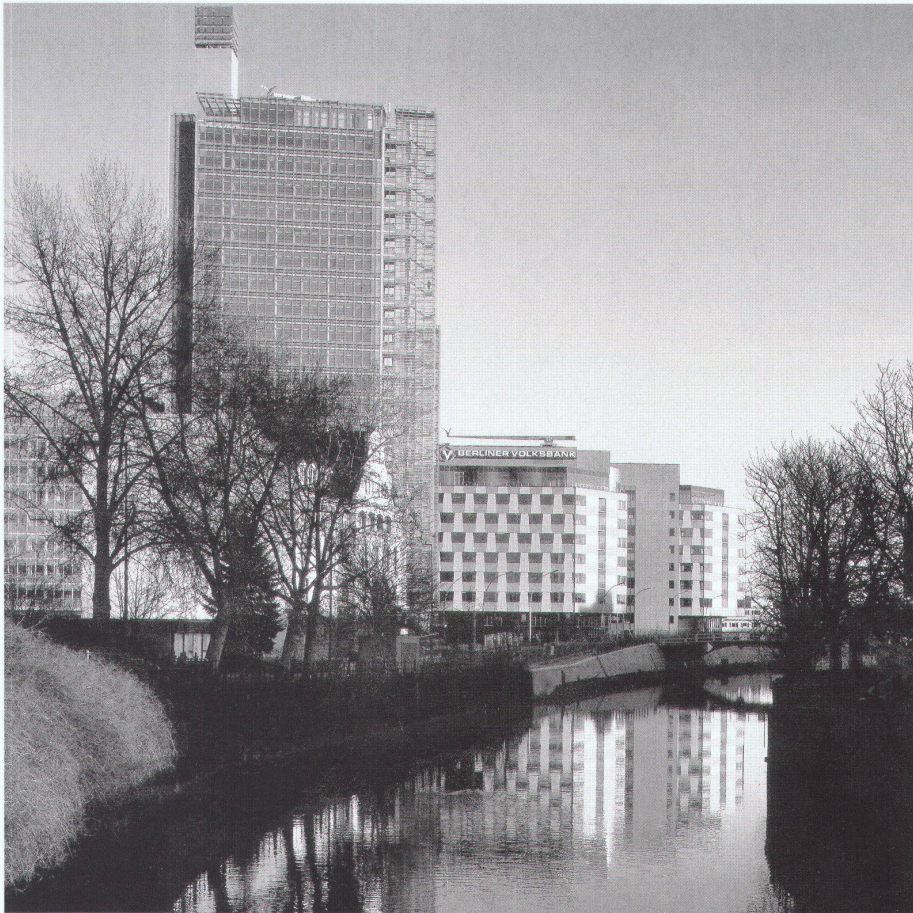
4, 5 | Steffen Lehmann Architekten Berlin und Arata Isozaki & Associates, Tokio: Zentrale der Berliner Volksbank am Potsdamer Platz, Berlin: Blick über den Landwehrkanal (links Hochhaus von Renzo Piano) und Ausschnitt der Keramikfassade