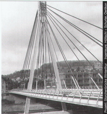
Projekt: Storchbrücke Winterthur Ingenieure: Hellschi + Schürter, Oerlikon

Nur mit diesem Baustoff sind die grössten Spannweiten möglich, dies mit Berücksichtigung der Wirtschaftlichkeit und des vorteilhaften Leistungsgewichtes. Stahl bietet eine nahezu unerschöpfliche Fülle von Möglichkeiten, Ihre Ideen zu verwirklichen.