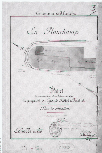
Situationsplan des Festsaals für das «Grand Hôtel» in Territet, von Marcel Chollet und Eugène Jost, 1894-95. Archives communales de Montreux, police des constructions

beiden Nachbarn des Archivio, das gta in Zürich und das AcM in Lausanne, ausführlich zu Wort kommen, zeugt vom guten Klima, das in diesem Kreis gemeinsamer Interessen herrscht. Man baut offensichtlich nicht auf Konkurrenz sondern auf Ergänzung und Zusammenarbeit – ein gutes Omen für die Zukunft.