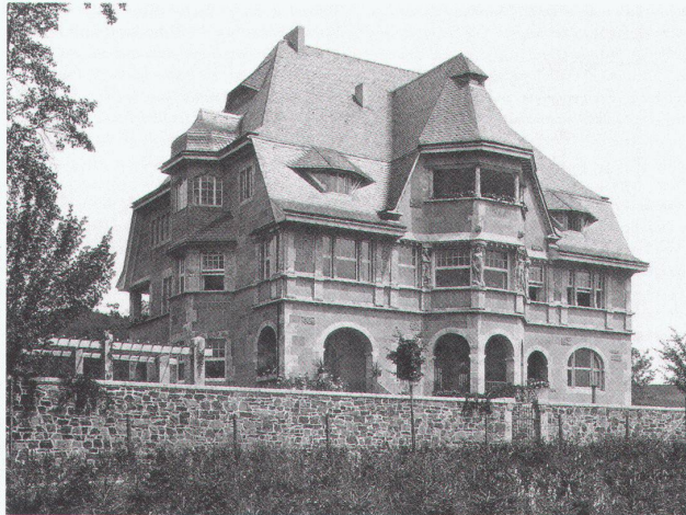
Villa Girardet, Hennef, 1904–1906

Bilder aus U.M. Schumann, Wilhelm Feilner von Tettau, Zürich 2002