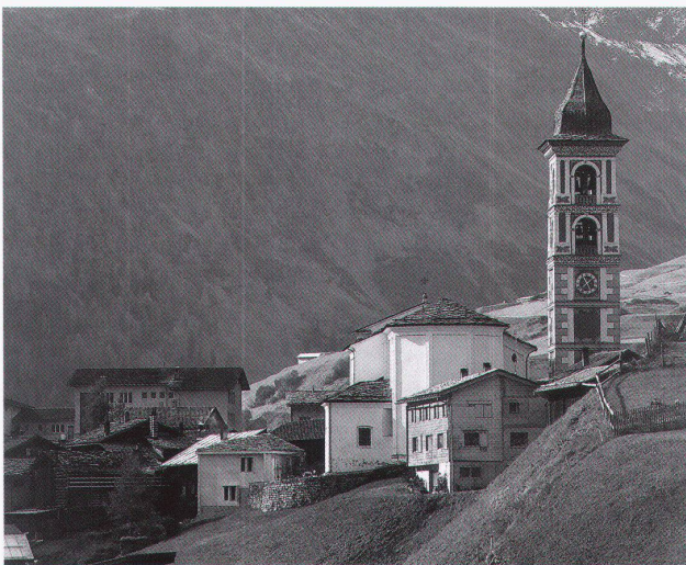
Gion A. Caminada. Stiva da morts, Vrin, 2002.

Sein wichtigster Bau ist die expressive Villa Girardet in Hennef, auch Feuerschloss genannt (1904–06). Tettau gewinnt vor dem finnischen Architekten Eliel Saarinen den öffentlichen Wettbewerb für das «herrschaftliche Wohnhaus» des Essener Verlegers Wilhelm Girardet. Die Komplexität und die künstlerische Ausformulie-