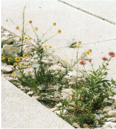
Lohaus & Carl, Quartierpark Nord, Hannover-Kronsberg.

und Platz betrachtet werden. Im London des 18. Jahrhunderts sowie in anderen Städten in England und Schottland zählten solche Schmuckplätze zu den wichtigsten öffentlichen Grünanlagen in wohlhabenden Stadtquartieren. Diese Squares – kultivierte Natur auf adretten Präsentiertellern – fanden schon bald in Europa und Nordamerika Verbreitung und werden noch heute, gerade wegen der wohlklingenden, assoziationsreichen Begrifflichkeit, gerne als planerisches Vorbild für Quartierparks zitiert, so etwa in der «EXPO-Siedlung» am Kronsberg bei Hannover.