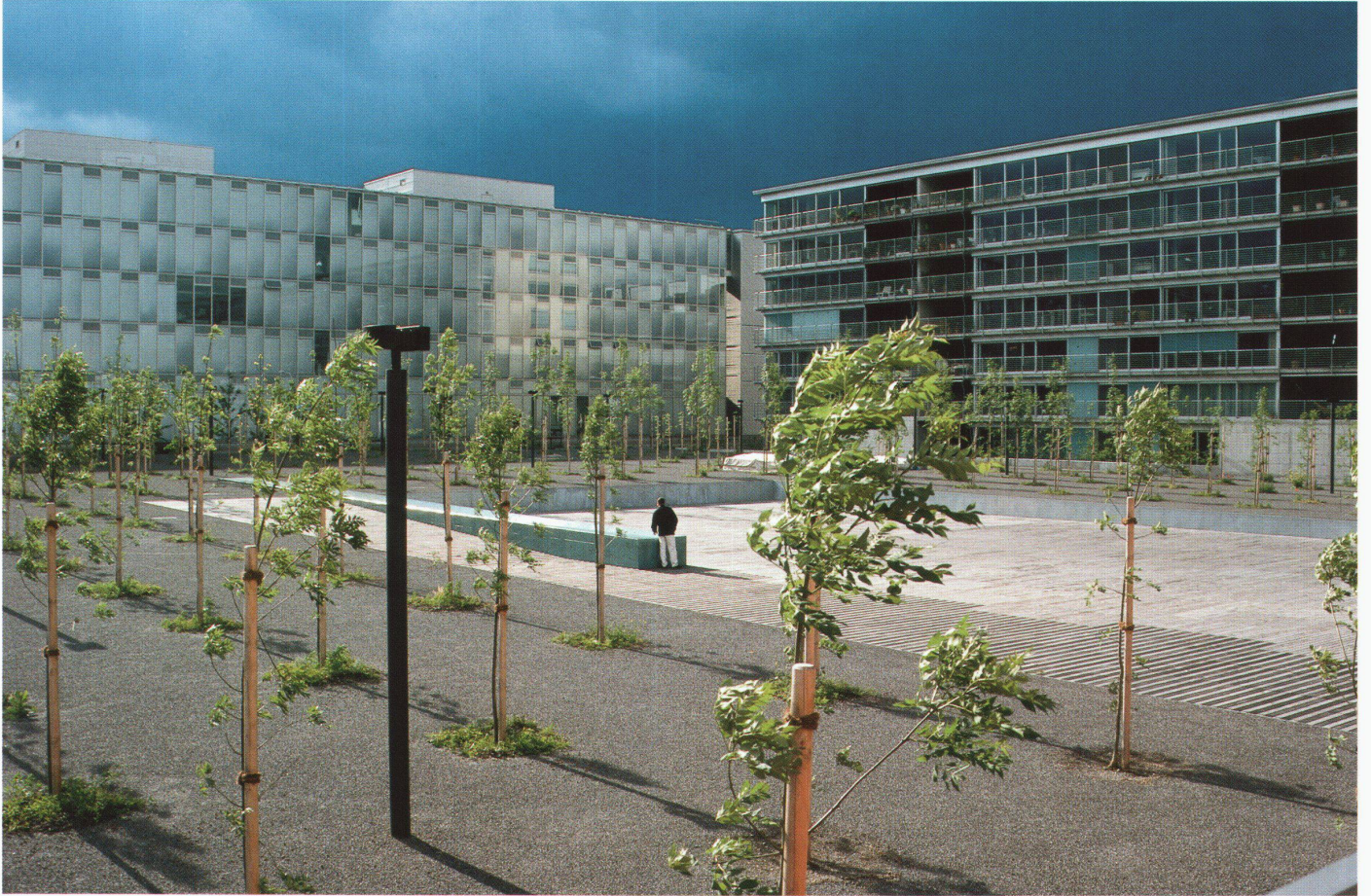
Zulauf Seippel Schweingruber / Hubacher Haerle, Oerliker-Park, Zürich (1996–2001).