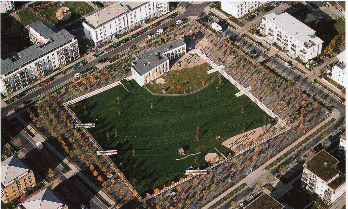
Lohaus & Carl, Quartierpark Nord (oben) und Mitte (unten), Hannover-Kronsberg (Projekt 1996, Ausführung 1999).