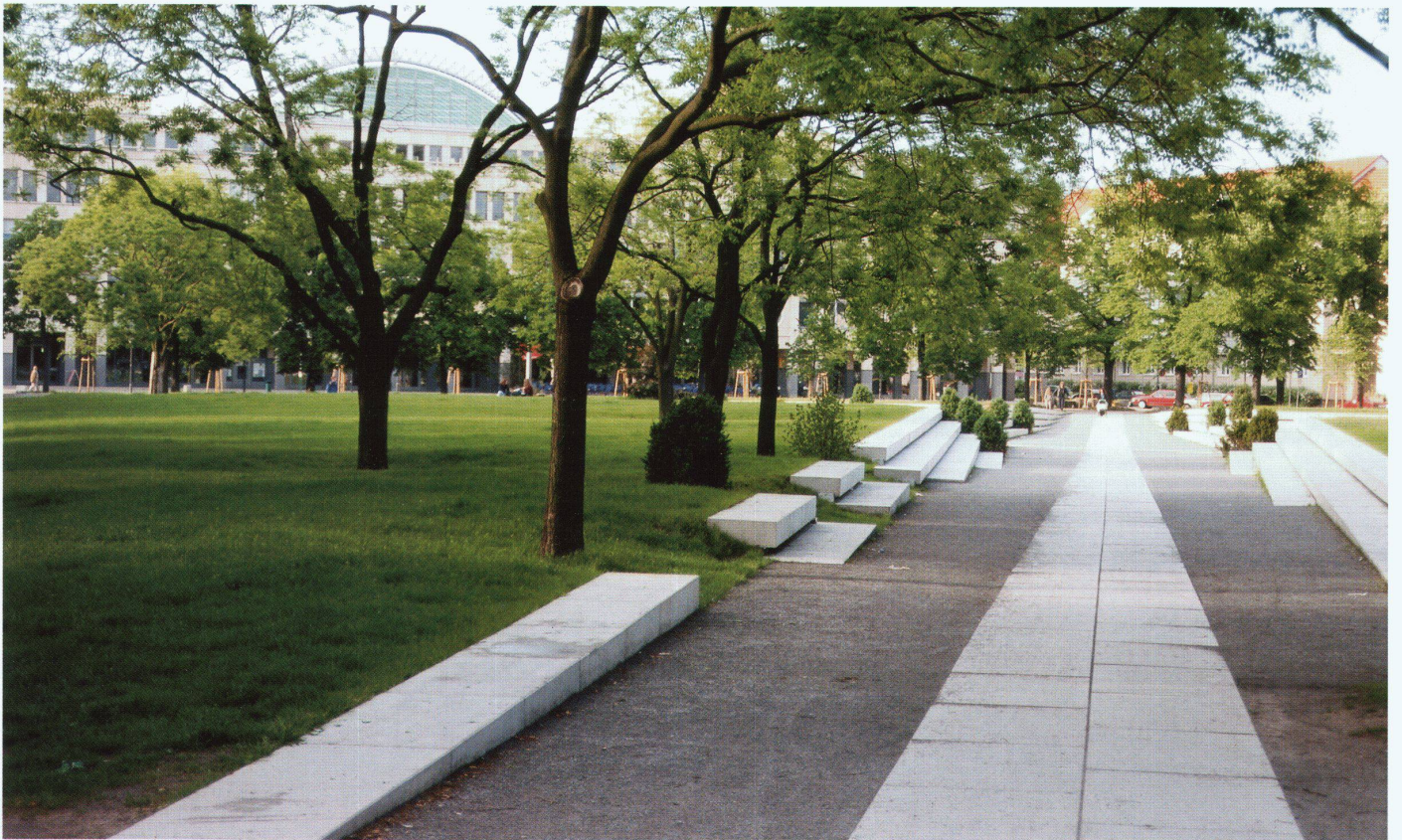
Wehberg Eppinger Schmidtke, Platz der Einheit, Potsdam (Projekt 1997, Ausführung 1998).