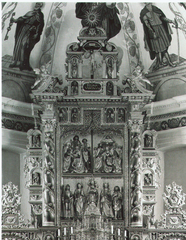
Hochaltar der Pfarrkirche Alvaneu GR. 1697 wurde der bestehende spätgotische Flügelaltar aus dem ersten Jahrzehnt des 16. Jh. zum barocken Hochaltar umgearbeitet. Der Schrein und die Flügel wurden übereinandergestellt und zu einem Mittelstück neu zusammengefügt, die Apostelfiguren des ehemaligen gotischen Altaruntersatzes setzte man in die rahmenden Nischen. – Bild: Romano Pedetti

Niemand bestreitet, dass das Gestern bereits Geschichte ist, dass die Vergangenheit in Dingen und an Orten präsent ist, an die sich die Erinnerungen knüpfen. Dem individuellen Reichtum der Erinnerungen entspricht die Vielfalt des Überkommenen. So ist alles «monumentum», gibt uns zu denken, macht uns auf etwas aufmerksam und ermahnt uns (lat. monere). An der Frage, wie wir mit diesem Reichtum umgehen dürfen und sollen, scheiden sich die Geister. In der